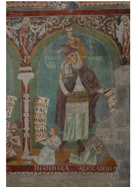
Détail des fresques de l' Anula Gotica (XIII e siècle) Rome, Basilica dei Santi Quattro Coronati

Mutations des sociétés politiques et système de communication (XIII e -XVII e siècle)